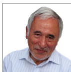
احمد میرزاخانی رئیس هیأت رئیسه